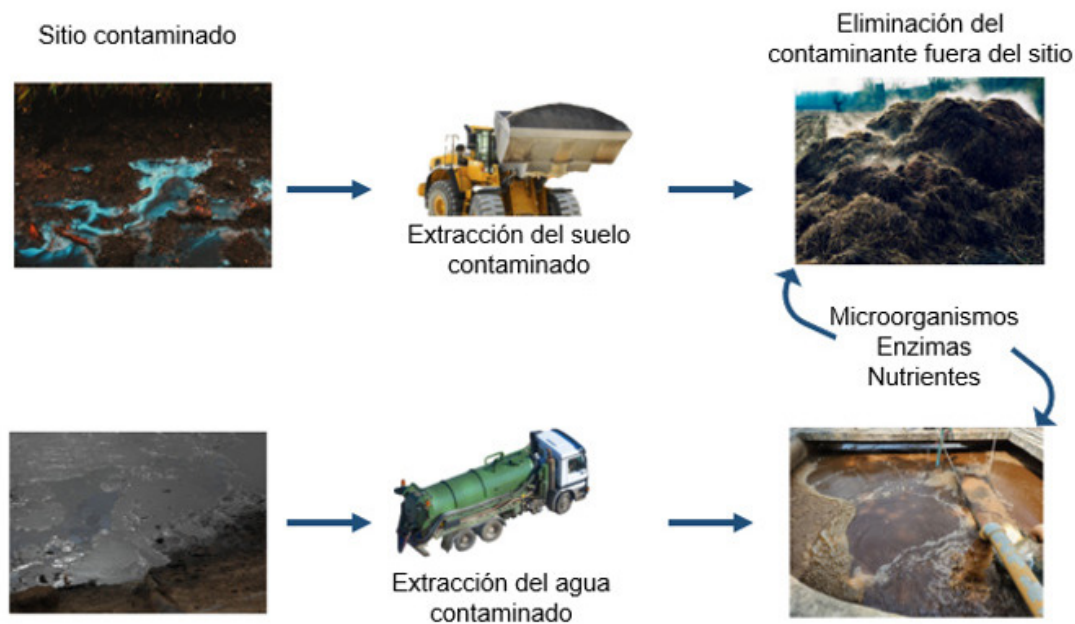
Figura 1. Biorremediación de suelo y agua: A) ex situ , B) in situ (Imagen creada parcialmente en Microsoft Designer).

para la degradación de compuestos fenólicos y tintes en aguas residuales (Okino-Delgado et al. 2019). Sin embargo, su aplicación a gran escala enfrenta desafíos importantes debido a los altos costos de producción y purificación de enzimas (Sosa-Martínez et al. 2022).