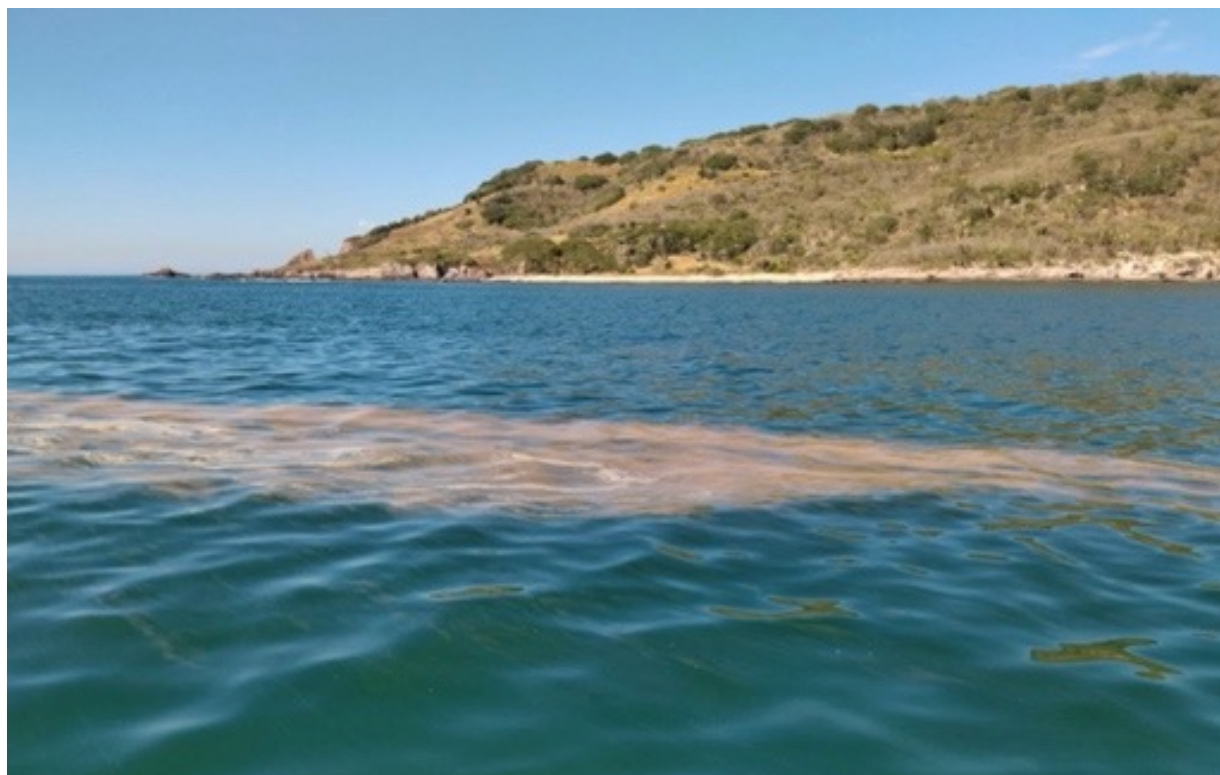
Figura 1. Florecimiento algal en Mazatlán, Sinaloa (2022).

Los FAN pueden formarse por una o varias especies de microalgas y cambiar o no el color del agua (Fig. 1, Reyes-Salinas et al. 2023). La aparición de estos eventos está relacionada con temperaturas favorables y la alta disponibilidad de nutrientes en el agua derivados principalmente de