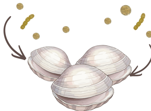
Figura 2. Los moluscos bivalvos se alimentan de microalgas suspendidas en el agua, incluyendo aquellas especies productoras de ficotoxinas.

En biología, un vector se define como un organismo vivo que transmite un agente patógeno de un organismo infectado a otro (EFSA 2025). En este contexto, los moluscos bivalvos son considerados vectores tradicionales de las ficotoxinas, debido a su tipo de alimentación por filtración, mecanismo que les permite retener las microalgas a través de sus branquias, las cuales son posteriormente ingeridas para obtener y almacenar sus nutrientes y toxinas en sus tejidos, estos regularmente pueden ser transferidos cuando son consumidos por otros organismos, incluido el humano (Fig. 2).